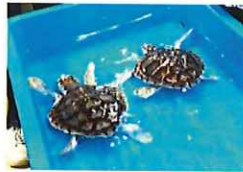
カメのあかちゃんの飼育もしています

鴨川シーワールドはシャチがいることで有名です！ シャチやイルカのパフォーマンスはもちろん楽しい！ 水族館の生き物の昼と夜の違いを見ることができるのは、 夜の水族館探検だからこそできる体験です！！ 水族館の取り組みや、海の生き物の「命」についても 考えてみましょう。